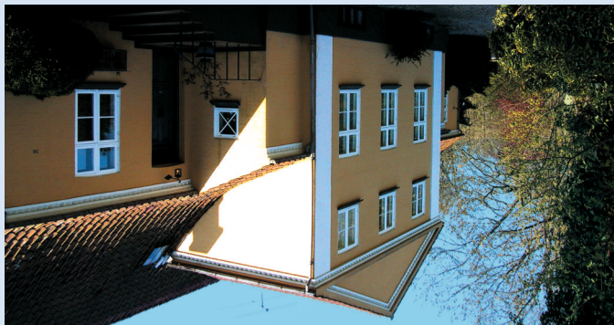
Klædefabrikken – nu privatbolig

I udkanten af Troense by fører stien dig ind gennem Kohaveskoven, som løber langs med Valdemars Slot. Her kan du se de formodede rester efter Troenses tidligere klædefabrik, hvor over 100 spindere og vævere i 1700-tallet var i sving med at omdanne råvarer som hør, uld og importeret bomuld til brugbart klæde. Fabrikken var et tidligt forsøg på at skabe industriel virksomhed på basis af husflid, og igangsætteren var atter Niels Juel, der med egne midler og penge fra stien kunne indkalde eksperter fra Tyskland. Den nuværende bygning har siden været såvel skovridter- som præstebolig.