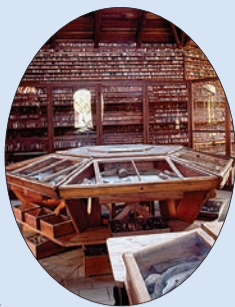
Oldsagssamlingen på Broholm

Broholm Gods er en af Danmarks ældste herregårde. Navnet Broholm kommer af, at hovedbygningen ligger på en ø, omgivet af dobbelte voldgrave. Allerede i 1326 blev Broholm omtalt første gang. Hovedbygningen er et lille, kompakt bygningsanlæg, hvor den rektangulære beboelsesfløj, der er udstyret med trappetårn, er bygget mellem 1641 og 1644. I dag er Broholm stadig ejet af slægten Sehested. Godset anvendes også til konferencer, fester, rundvisninger og overnatning. Du kan opleve Broholm Gods på nært hold fra Eventyrløjfen. Stisløjfen fører igennem det gamle engelsk inspirerede parkanlæg med kanaler og holme. Stien starter ved parkeringspladsen vest for godset.