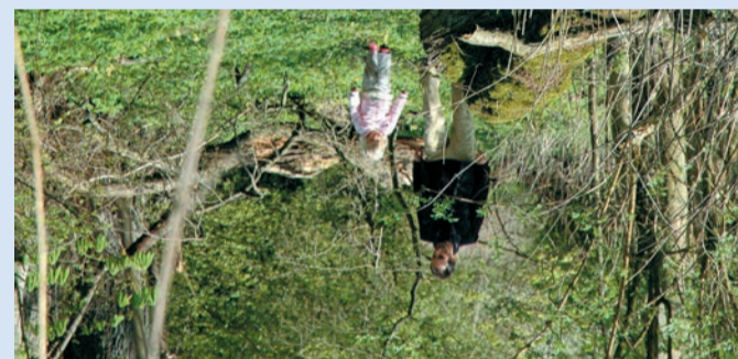
På tur ved Broholm

Øhavsstien bliver en af Danmarks længste vandrutier med omkring 200 km. Stien er lavet for vandrere og forløber således kun undtagelsesvist på asfalterede veje. Når stien i løbet af 2007 bliver færdiggjort, vil den omkranse Det sydlynske Øhav.