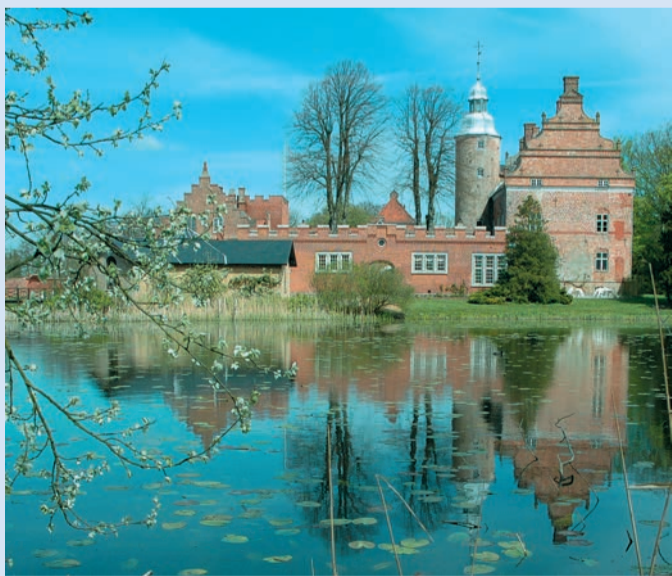
Broholm Gods set fra Eventyrstien

Kulturen i det sydøstfynske landskab var 300-400 år efter vores tidsregning helt specielt. Her lå den største bebyggelse af jernalder-langhuse, op til 35 meter lange. Egnen blev styret fra Gudme hvor den rige stormand eller konge boede. I Lundeborg ved kysten lå hans mægtige handelsplads, hvor håndværkere arbejdede i bronze, jern, guld og sølv. Mange skibe anløb stranden med varer fra Romerriget. Gudmeegnen er et centralt punkt i danmarkshistorien sådan som turistfor- eningen udtrykker det med vendingen »her blev Danmark til«.