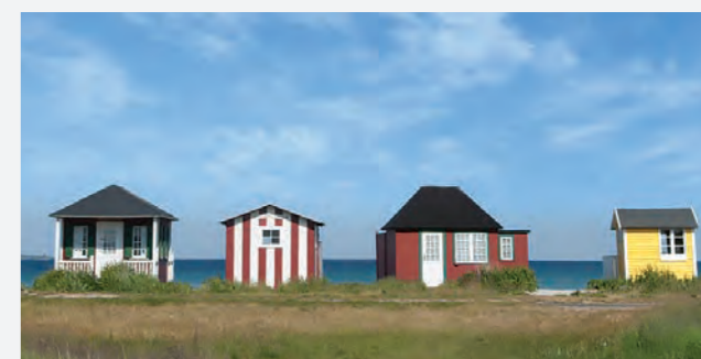
Strandhuse ved Vesterstrand.

Badehusene ligger to steder på Ærø: På Eriks Hale ved Marstal og på Vesterstrand ved Ærøskøbing. Begge steder er husene