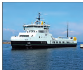
Ellen i Søby Havn

Ellen er resultatet af et femårigt innovationsprojekt og er blandt Realdanias 100 bedste, danske klimaløsninger. Hendes primære rute er Søby-Fynshav.