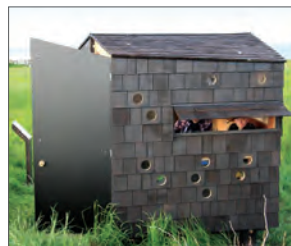
Shelters på Birkholm. Bookes på www.bookenshelter.dk

Birkholm er en af de mindste beboede danske øer. Midt i Det Sydfynske Øhav ligger den med sine kun 96 ha, ganske flad og kun 1,8 meter over havet. Birkholm hører under Ærø Kommune og besejles 2 gange dagligt med en lille moderne postbåd, som også kan medtage passagerer i et beskedent omfang. Se mere på www.birkholm-beboerforening.dk