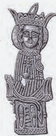
Pilgrimstegn fra Skt. Alberts Kirke

Ved Vejsnæs Nakke ses sporene af Skt. Alberts Kirke, der oprindeligt blev opført som fæstningsværk. Dateringen formodes at være vikingetid omkring år 1000. I 1300-tallet blev anlægget ændret og en kirke blev opført på stedet. Fund på stedet indikerer, at kirken var i brug frem til reformationen i 1536. Omridset af kirken er markeret med jordvold.