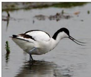
Klyden yngler på Vitsøs fugleøer.

Vitsø var oprindeligt en fjordarm, men blev i 1781 tørlagt så meget, at det opståede engområde kunne afgræsses af kreaturer. I 1964 blev noret afvandet nok til at jorden kunne dyrkes som landbrugsjord. I 2009 blev søen og engområdet (i alt 112 ha) genskabt og Vitsø og vådområdet Søby Måe er i dag en vigtig lokalitet for mange trækfugle, som kan raste og yngle på de små fugleøer, der er etableret i søen. Der er anlagt en sti hele vejen rundt om Vitsø, hvorfra fuglelivet og naturen kan opleves på tæt hold.