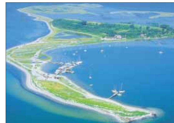
Korshavn i forgrunden og Fyns Hoved i baggrunden.

Siden århundredskiftet har fiskere fra Kerteminde fisket fra Korshavn. I dag holder 3-4 fiskekuttere til her. Dybt vand tæt på land og store sten giver gode muligheder for torsk.