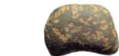
Rombe Porfyr – en sten fra Fyns Hoved

Senere i stenalderen steg havet så meget, at det nordlige Hindsholm blev opdelt i mange øer. Jøvets vestkyst er for eksempel en gammel kystklint. Senere har landet hævet sig halvanden meter og derved forbundet øerne med hinanden. Øksnehaven er naturlig tørlagt havbund, hvor øen Søbjerg er en bakke i det flade landskab.